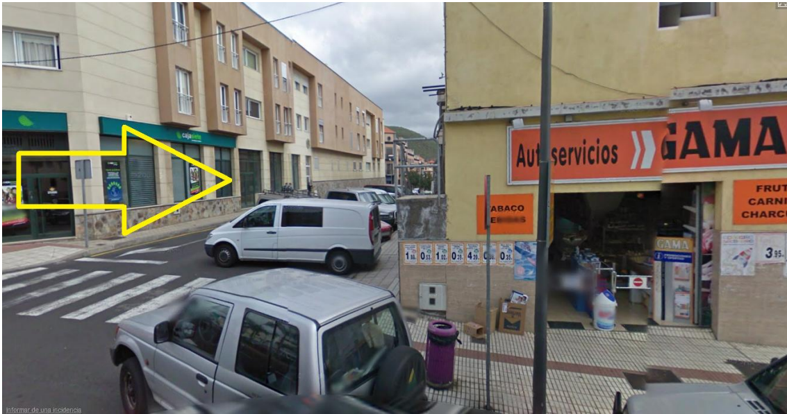
Entrada a la calle Santa Eulalia, para quien va caminando.