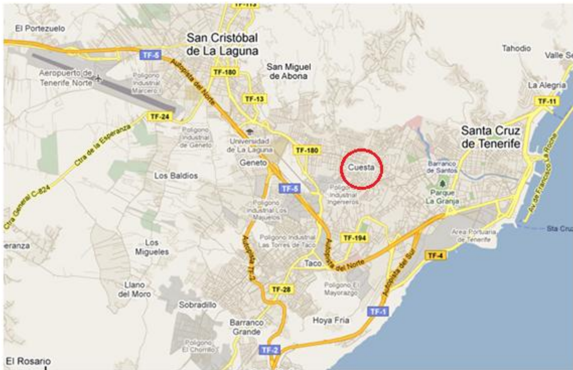
Vista general de Tenerife y el local en La Cuesta, La Laguna.