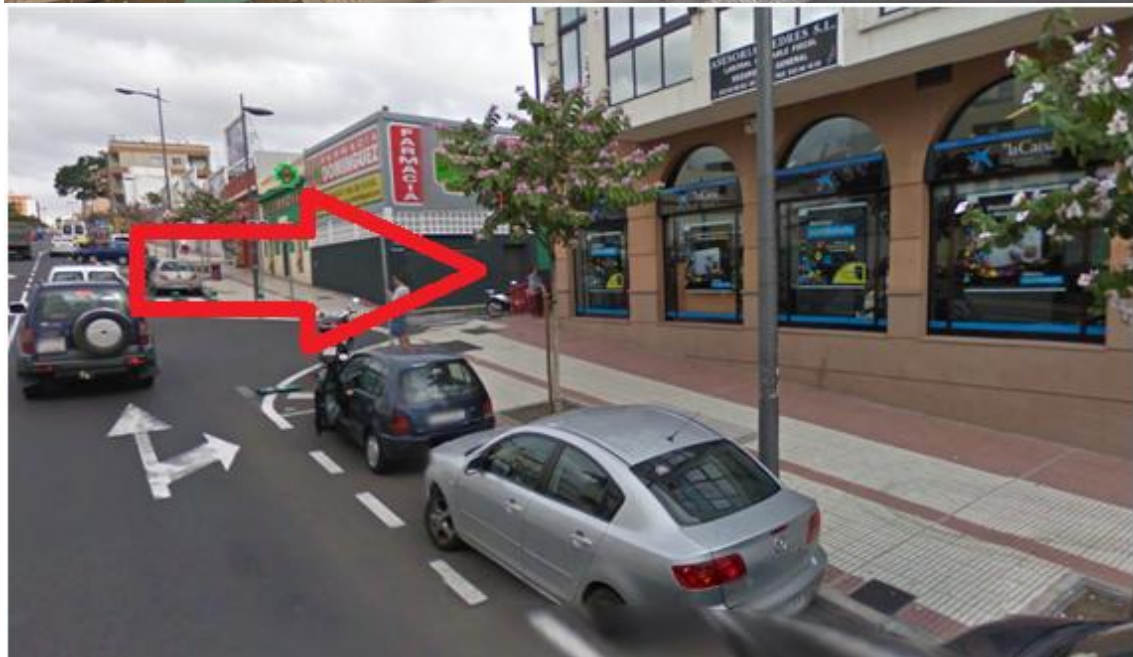
Entrada en coche a la calle San Juan, paralela a Calle Santa Eulalia.